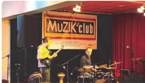
Muzik'club du 2 mars : présentation du travail des élèves avec leurs professeurs (batterie et guitare)