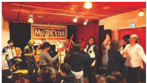
Une musique très entraînante, qui a invité le public à danser