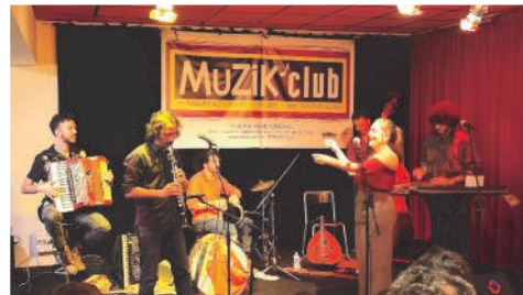
Le groupe Assafir, de musique «Balkans oriental», en présence d'un public nombreux